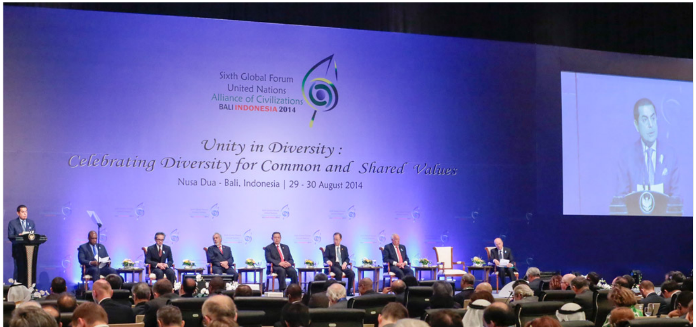
Le forum mondial de l'Alliance des civilisations à Bali, en Indonésie.

29 août 2014 – Lors du début vendredi du forum mondial de l'Alliance des civilisations à Bali, en Indonésie, l'Organisation des Nations Unies a salué le rôle important de cette initiative pour promouvoir la paix, particulièrement à la lumière de l'instabilité considérable dans de nombreuses régions du monde actuellement.